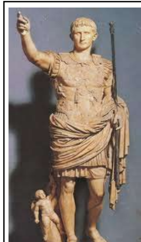
Kaiser Augustus, erster römischer Kaiser, urspr. Gaius Oktavianus, Großneffe und Adoptivsohn von Julius Cäsar. Geb. am 23.9. 63 v.Chr., gest. am 19.8.14 n.Chr.,

Aber bleiben wir bei den Texten der Bibel. Da werden die Regierungsdaten von Augustus und Herodes genannt. Beide Herrscher waren zur Geburt Jesu an der Macht, so muss Jesus vor 4 v.Chr. geboren sein. Doch zum Todesjahr Hero-