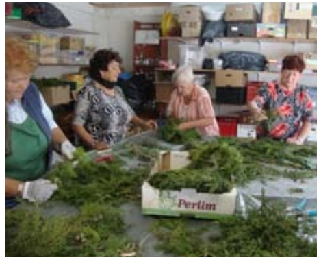
Kreativkreis im Nov. 11