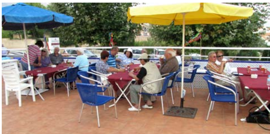
2.10.2011 Terrasse in Montebello