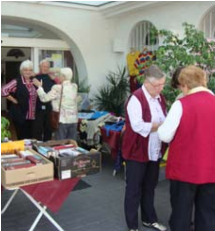
20.11.11 Kreativkreis in Montebello