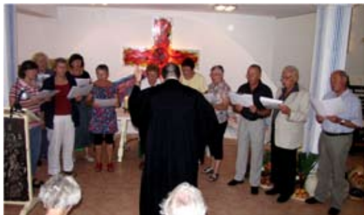
2.10.2011 Chor des Pfarramtes